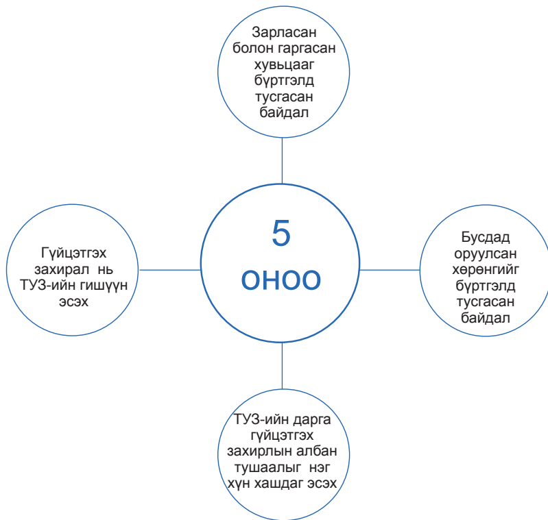
Зураг 2. Эрдэнэс Оюу толгой ХХК-ийн засаглалын үнэлгээнд сайн үнэлгээ буюу 5 оноо авсан асуулгууд

Үүнээс гадна үнэлгээний үзүүлэлтийн нийт 117 асуулгаас 83 буюу 71 хувьд нь “0” оноо авсан нь эдгээр үзүүлэлтийн хүрээнд тус компани тодорхой зүйл хийгээгүй байгааг харуулж байна. Энэ нь тус компанийн засаглалын түвшин доогуур гарах гол шалтгаан болсон байна. Нийт үнэлгээнд “0” үнэлгээ авсан үзүүлэлтүүдийн эзлэх хэмжээг Хүснэгт 2-т үзүүлэв.